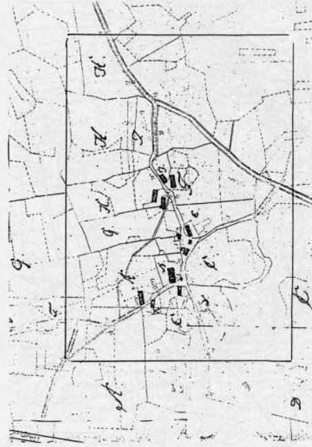
Udsnit af udskiftingskort over Lundtoft 1796, visende gårdenes beliggenhed i byen.