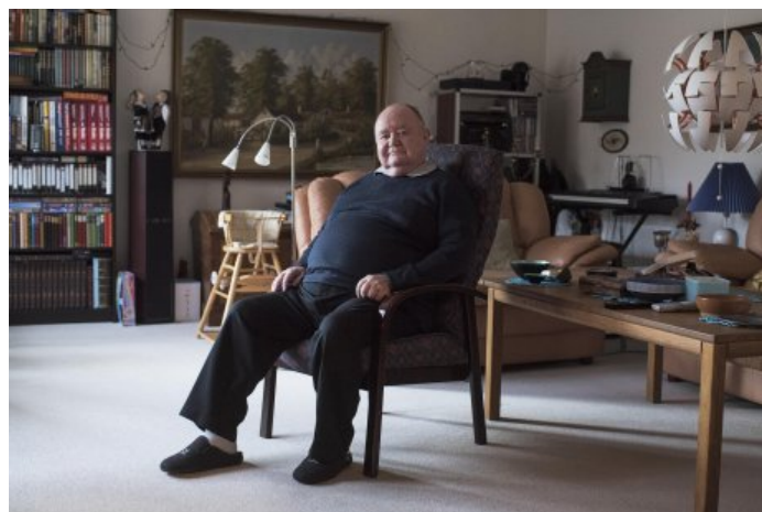
»Dengang grinte vi lidt ad