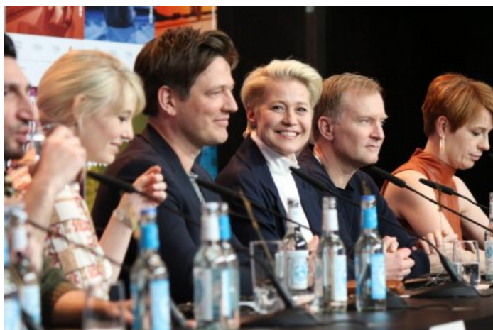
Danskernes dag i Berlin