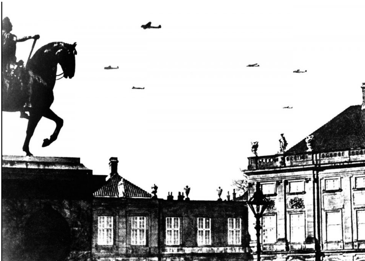
Tyske fly henover Amalienborg sloit den 9 april om morgenen

Et stort grin flækkede næstkommanderendes ansigt.