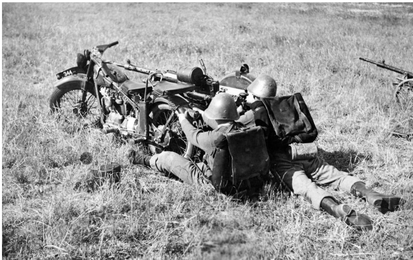
Danske soldater med en 20 mm Madsen-kanon.

Naturligvis vil Danmark overleve. Mange danskere fatter ikke, at det kræver en indsats at overleve. Denne vilje er en markering over for os selv, og især over for udlandet. Uden viljen mister man retten til at overleve. Hvis en nation vil overleve, må nogen dø. Så enkelt er det, og sådan har det altid været.