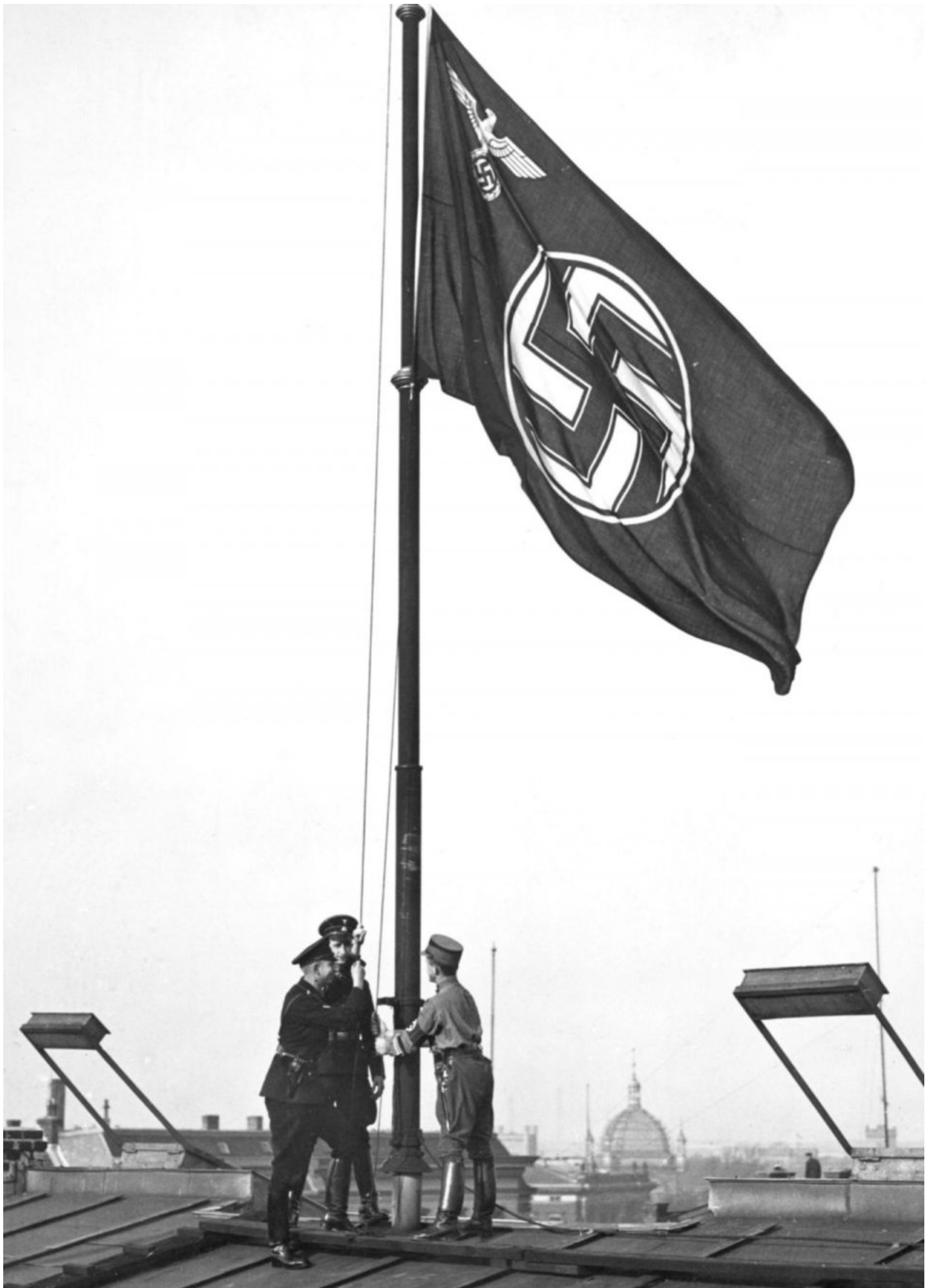
København den 9. april 1940. Besættelsen af Danmark er igang og slutter først 5 maj 1945. Her hejser tyske tropper deres flag.